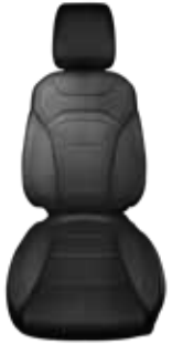
Siyah Nappa Deri