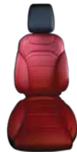
Kırmızı Nappa Deri